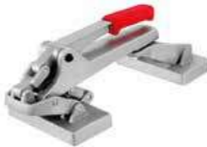
Т Двойной стретчер