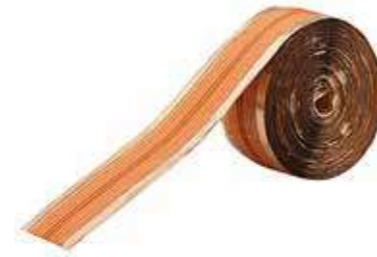
Т Термолента для склейки ковровина