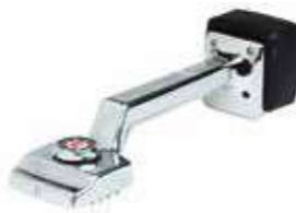
Т Коленный стретчер