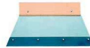
Т Шпатель для вкладышей 21 или 28 см (нержавеющая сталь) Предназначен для нанесения клея при укладке ковровина.