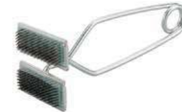
Т Зажим для швов ковровых покрытий