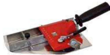
Т Полосорез 3-10 см Используется для нарезки полос от 3 до 10 см