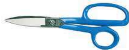
Т Ножницы Miniket