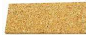
Т Пробковая доска Используется для разглаживания напольных покрытий и удаления воздушных пузырей