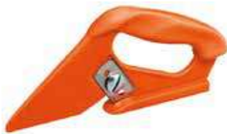
Т Нож для резки сверху