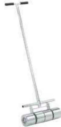
Т Вальцы прикаточные 50 или 75 кг