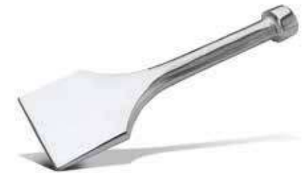
Т Лопатка стальная 9 см