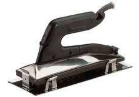
Т Утюг для склейки ковровина