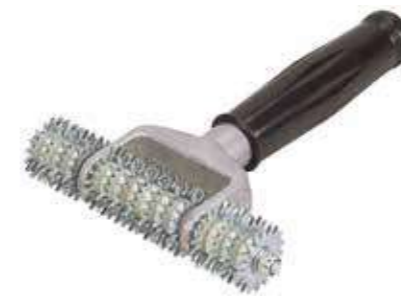
Т Игольчатый ролик