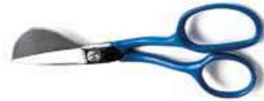
Т Ножницы ворсовые