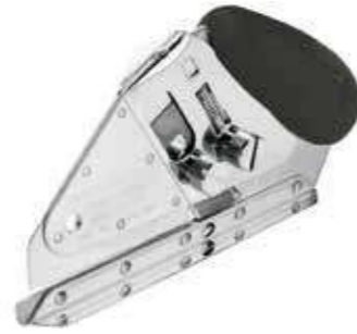
Т Нож для резки ковровина