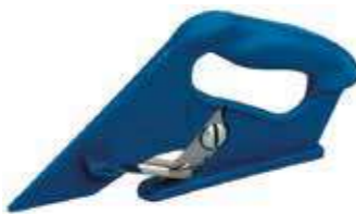
Т Нож для резки снизу