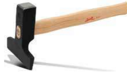
Т Кромковтирочный (компрессионный) молоток, (цельнокованный) 3кг Рекомендуется для притирки и разглаживания напольного покрытия в местах стыка и трудно доступных местах, не царапая поверхность.