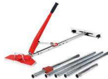
Т Рычажный стретчер