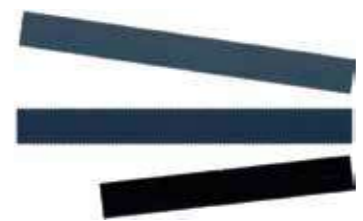
Т Вкладыши в шпатель В1, В2 (21 или 28 см)