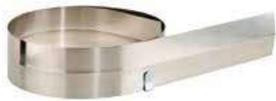
Т Линейка, сталь, 210x8 и/или 410x8 см